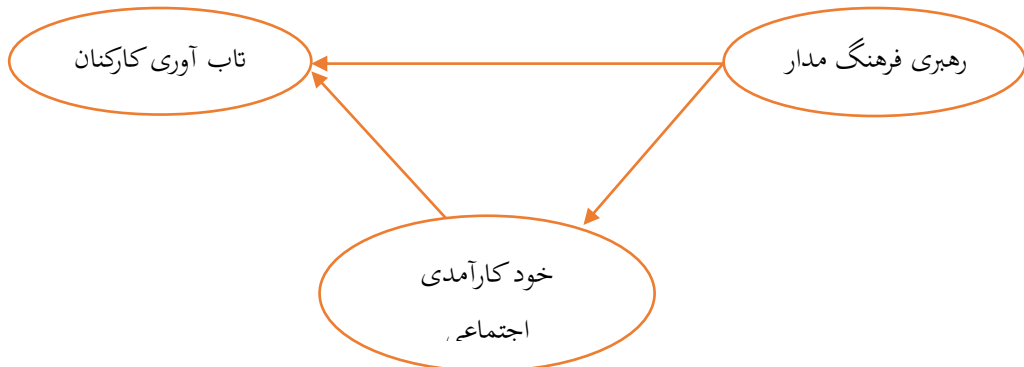
شکل ۱- مدل مفهومی تحقیق

محقق در تدوین چارچوب تئوری این پژوهش از مبانی تئوری و نظری پژوهش استفاده نموده که برگرفته از اندیشه‌ها و نظریات صاحب نظران و اندیشمندان علم مدیریت است. در طراحی متغیرها و ابعاد آن‌ها برای رهبری فرهنگ مدار از پرسشنامه وظیفه و همکاران (۱۳۹۵) در زمینه ابعاد خودکارآمدی اجتماعی از نظریات سجادپور و همکاران (۱۳۹۳) و تاب آوری از نظریات (کونور و دیویدسون، ۲۰۰۳) استفاده گردید. که خودکارآمدی اجتماعی به‌عنوان متغیر میانجی، رهبری فرهنگ مدار به‌عنوان متغیر پیش‌بین و تاب آوری به‌عنوان متغیر ملاک در نظر گرفته شده است. این پژوهش با تکیه بر مطالب فوق و تئوریهای صورت گرفته به بررسی تاثیر رهبری فرهنگ مدار بر تاب آوری با نقش میانجی خودکارآمدی اجتماعی در بین کارکنان دانشگاه آزاد اسلامی استان اردبیل با توجه به چارچوب نظری ذیل می‌پردازد.